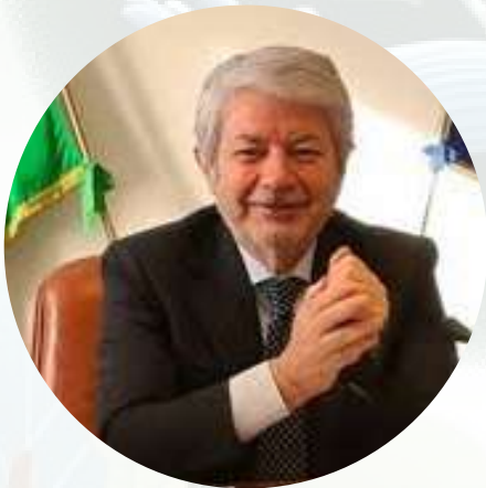
Antonio Naddeo Presidente dell'Agazia per la rappresentanza negoziale delle pubbliche amministrazioni - ARAN