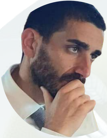
Cosimo Elefante Direttore del Dipartimento per la Transizione Digitale della Regione Puglia